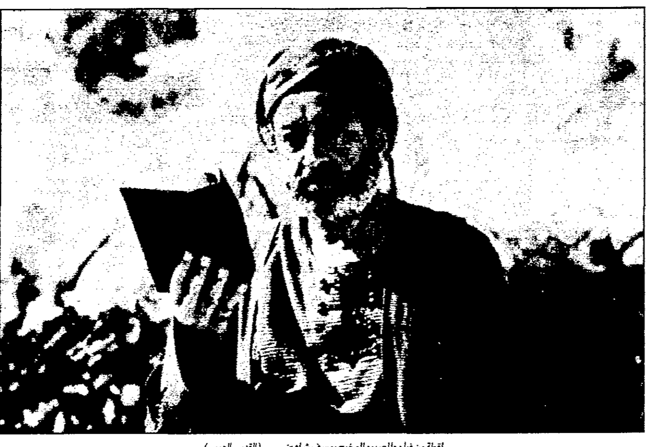
لقطة من فيلم «المصير» للمخرج يوسف شاهين